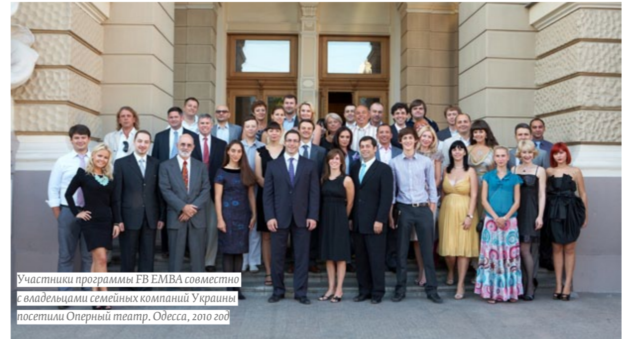
Участники программы FB EMBA совместно с владельцами семейных компаний Украины посетили Оперный театр. Одесса, 2010 год