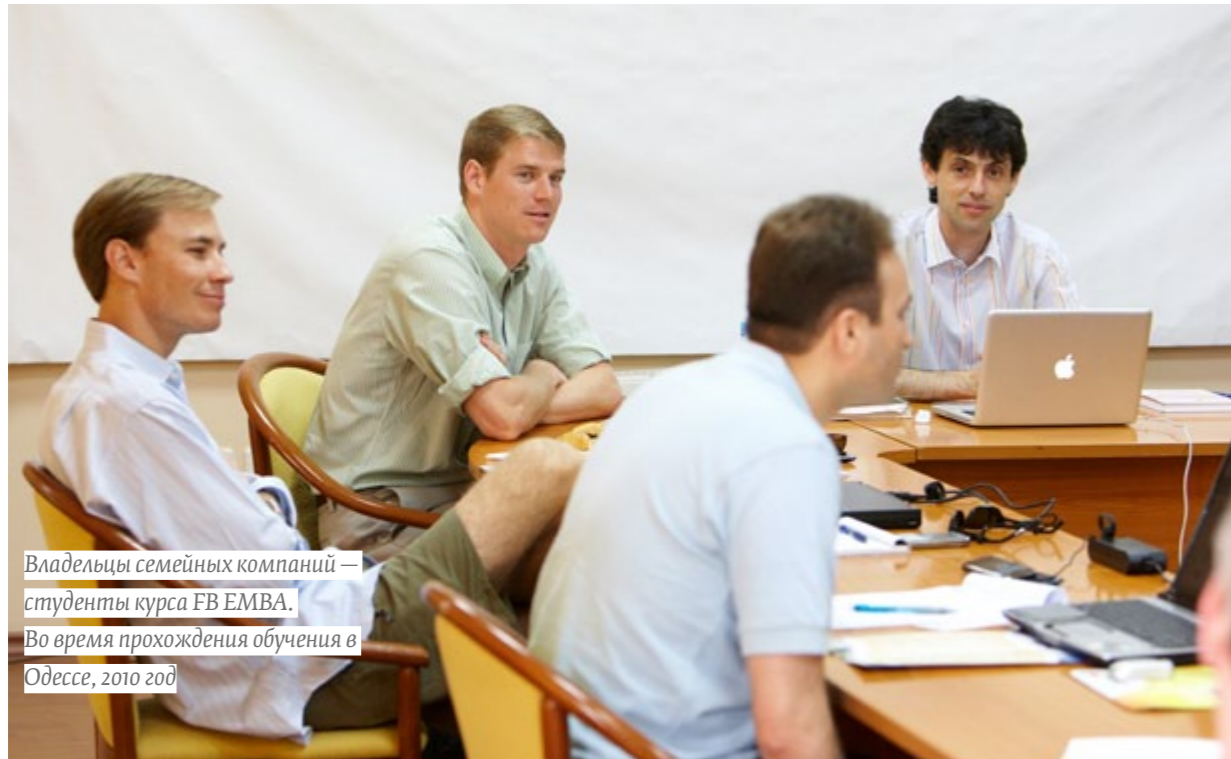
Владельцы семейных компаний — студенты курса FB EMBA. Во время прохождения обучения в Одессе, 2010 год