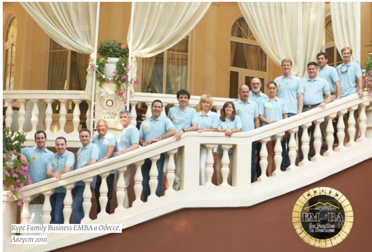
Курс Family Business EMBA в Одессе. Август 2010

FAMILY BUSINESS EMBA — ЭТО ЕДИНСТВЕННАЯ ПРОГРАММА В МИРЕ, ОБУЧАЮЩАЯ ВЛАДЕЛЬЦЕВ И УПРАВЛЯЮЩИХ СЕМЕЙНОГО БИЗНЕСА БОЛЕЕ КАЧЕСТВЕННОМУ ВЛАДЕНИЮ И УПРАВЛЕНИЮ.