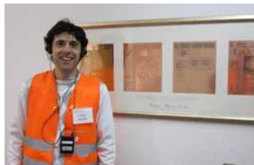
Возле стенда с совместными достижениями издательского дома Burda и фабрики Myllykoski. Мюнхен, Германия

EMBA был интересен для меня еще и тем, что все девять резиденсов происходили в разных странах и в разных семьях, и все это время профессора были с нами. Мы изучали множество теоретического и лекционного материала, и теория у нас очень плотно перемежалась с практикой. Мы посетили семейные заводы, типографии, винодельческие предприятия, но что особенно важно, мы были приглашены в дома, а зачастую там жили, получая уникальную возможность изучить семейные традиции. Я не знаю ни одной подобной программы, где мы могли бы так плотно взаимодействовать с семьями, узнавая их изнутри. Мы чувствовали себя членами одной семьи: нас принимали как самых близких родственников.