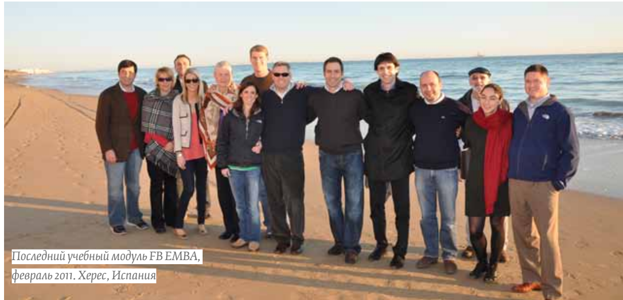
Последний учебный модуль FB EMBA, февраль 2011. Херес, Испания