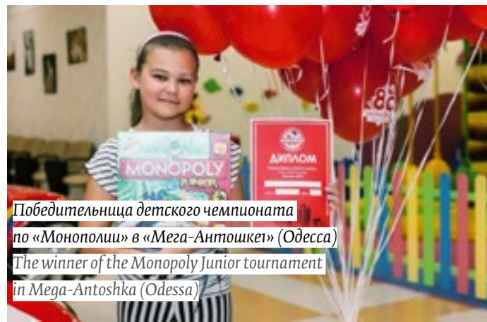
Победительница детского чемпионата по «Монополии» в «Мега-Антошке» (Одесса) The winner of the Monopoly Junior tournament in Mega-Antoshka (Odessa)