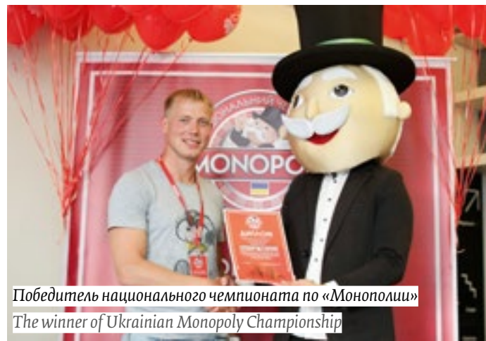
Победитель национального чемпионата по «Монополии» The winner of Ukrainian Monopoly Championship