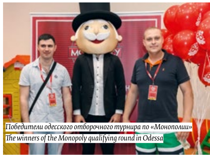
Победители одесского отборочного турнира по «Монополии» The winners of the Monopoly qualifying round in Odessa