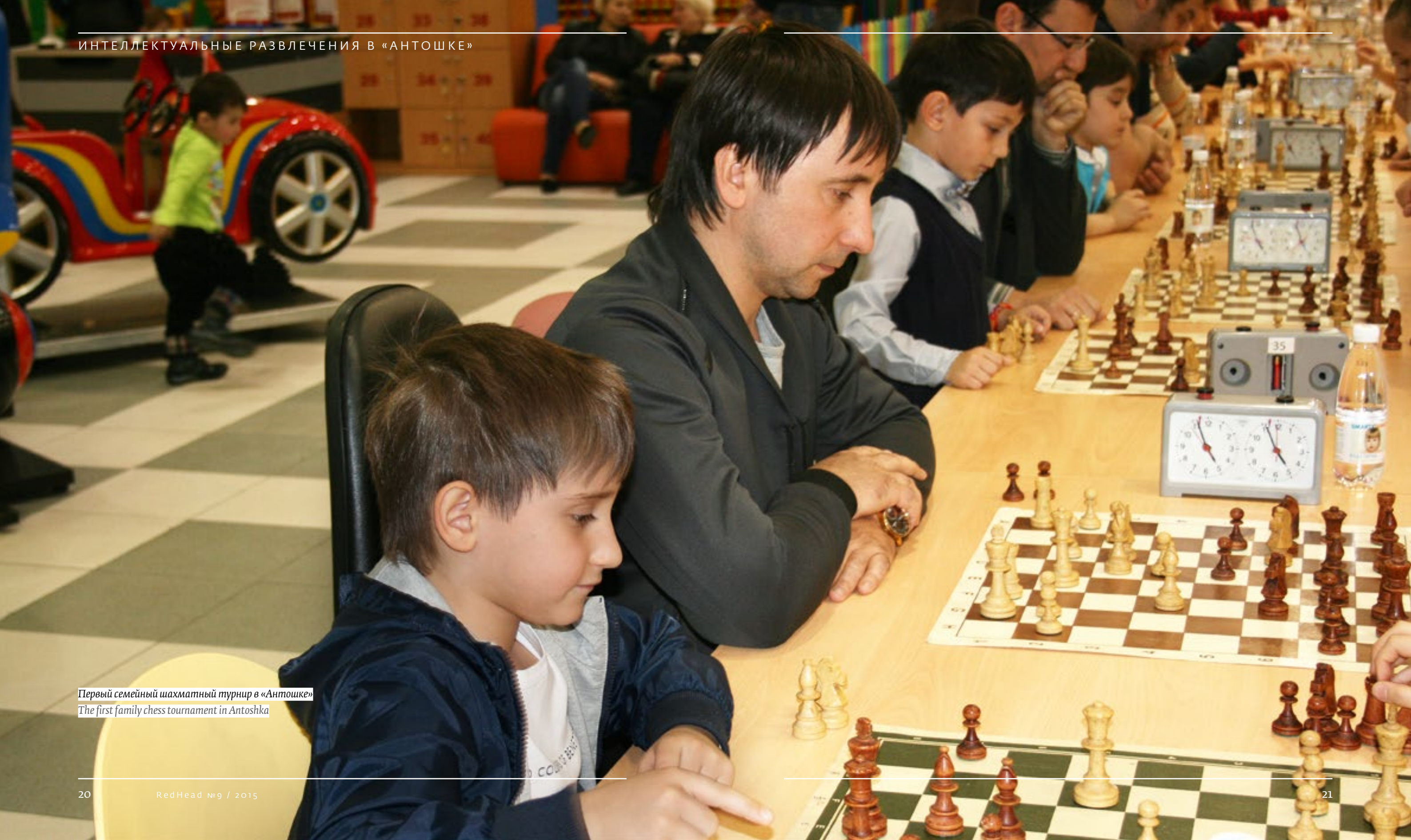
Первый семейный шахматный турнир в «Антошке» The first family chess tournament in Antoshka