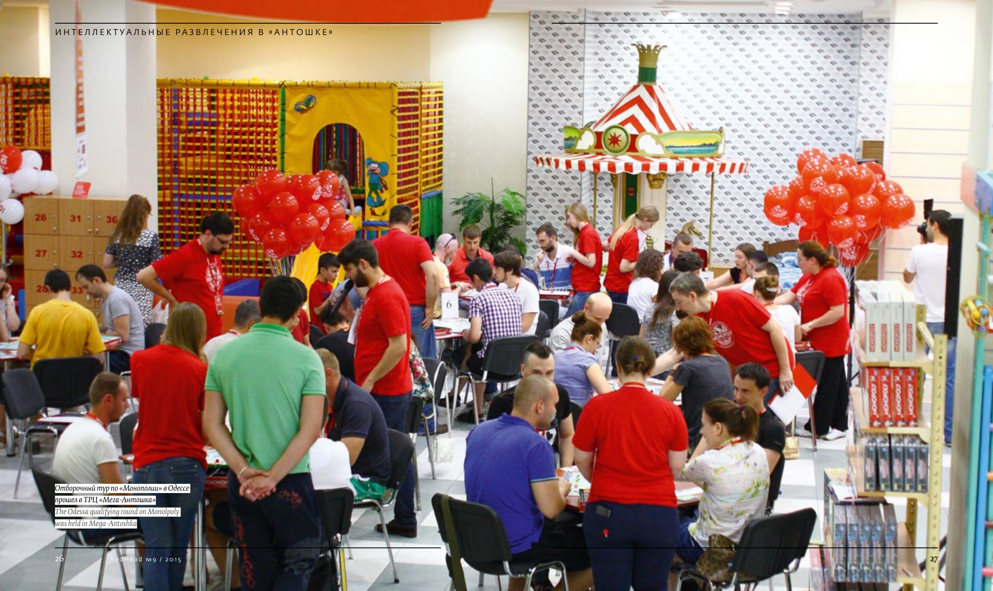
Отборочный тур по «Монополии» в Одессе прошел в ТРЦ «Мега-Антошка» The Odessa qualifying round on Monopoly was held in Mega-Antoshka