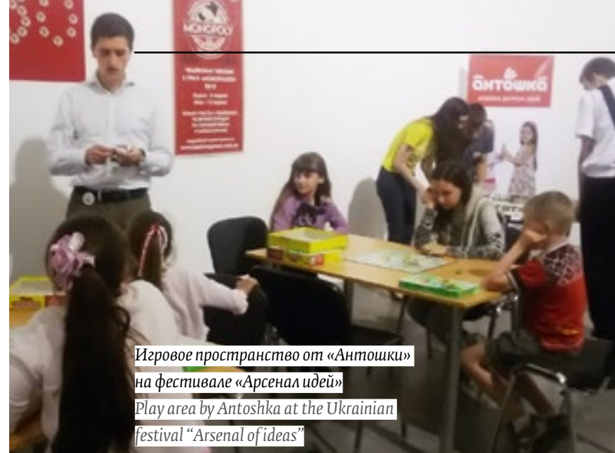
Игровое пространство от «Антошки» на фестивале «Арсенал идей» Play area by Antoshka at the Ukrainian festival "Arsenal of ideas"