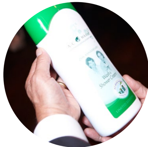
Сувенирный флакон Bübchen в честь 25-летия А. С. Haase Osthandelsgesellschaft mbH

На первом свидании она спросила: «Ты хочешь меня или мои контакты?». Он ответил: «И то, и другое». Она призналась откровенно и безапелляционно: «Я родилась, чтобы быть боссом». Он парировал: «У меня примерно такая же миссия, но я подстроюсь!».