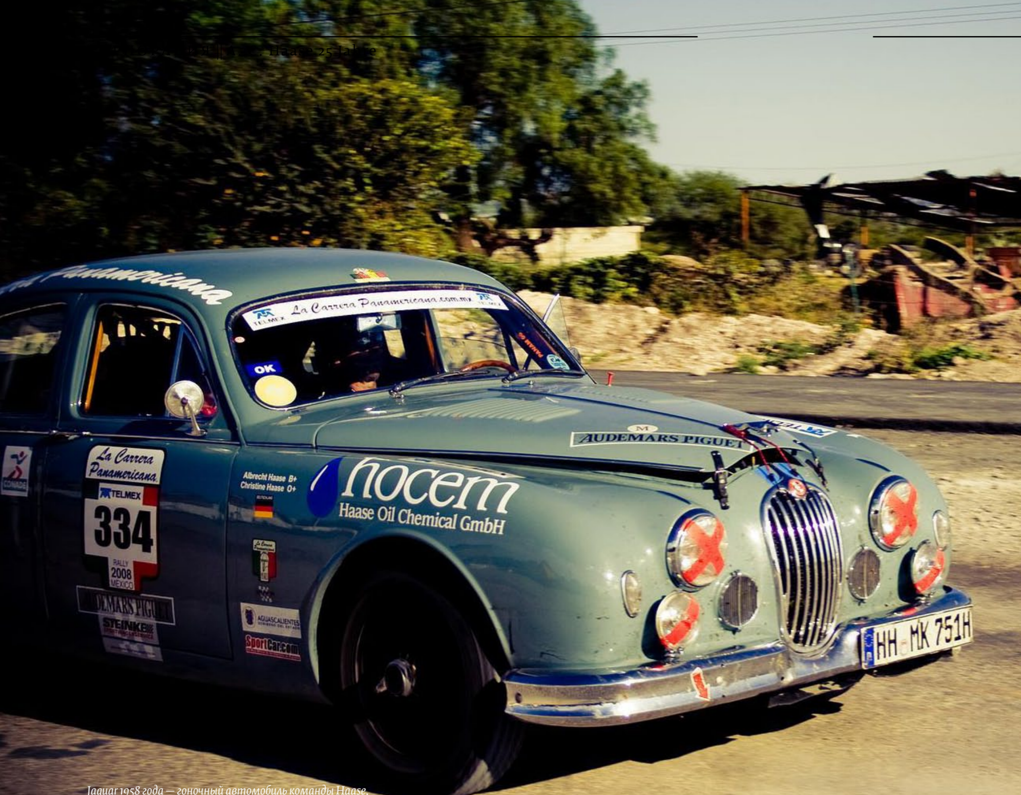
Ягуар 1958 года — гоночный автомобиль команды Haase, обладатель титула «Самая красивая машина» (Rally Mexico, 2006)